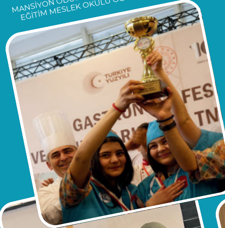
MEB GASTRONOMİ FESTİVALİ VE YEMEK YARIŞMASI MANŞİYON ÖDÜLÜ KONYA KARATAY ÖZEL EĞİTİM MESLEK OKULU ÖĞRENCİLERİ