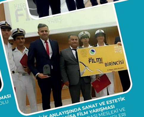
AHİLİK ANLAYIŞINDA SANAT VE ESTETİK KONULU KISA FİLM YARIŞMASI İ.Sİ MERSİN TİCARET ODASI MESLEKİ VE TEKNİK ANADOLU LİSESİ ÖĞRENCİLERİ